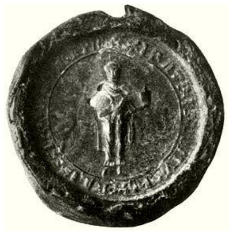
Ispotályos lovag gyógyszeres edénnyel a XIII. században, a budafelhévízi rendház pecsétjén 385

budafelhévízi házaik - által kiállított oklevél intitulációinak és inscripcióinak – címzésének - elemzése kapcsán bizonyítja a rend szerepét és helyét a korabeli oklevélkiadás terén. 384